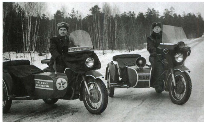
Патрульные мотоциклы военной комендатуры и военной автоинспекции

В Советской армии коменданты гарнизонов решали, в общем, те же задачи, что и в царской. При этом гарнизон города Москвы, так же, как и в дореволюционные времена, стоял особняком среди всех других территориальных гарнизонов. Это было связано, во-первых, с положением Москвы как столицы государства, а во-вторых, с большим числом воинских частей и учреждений,