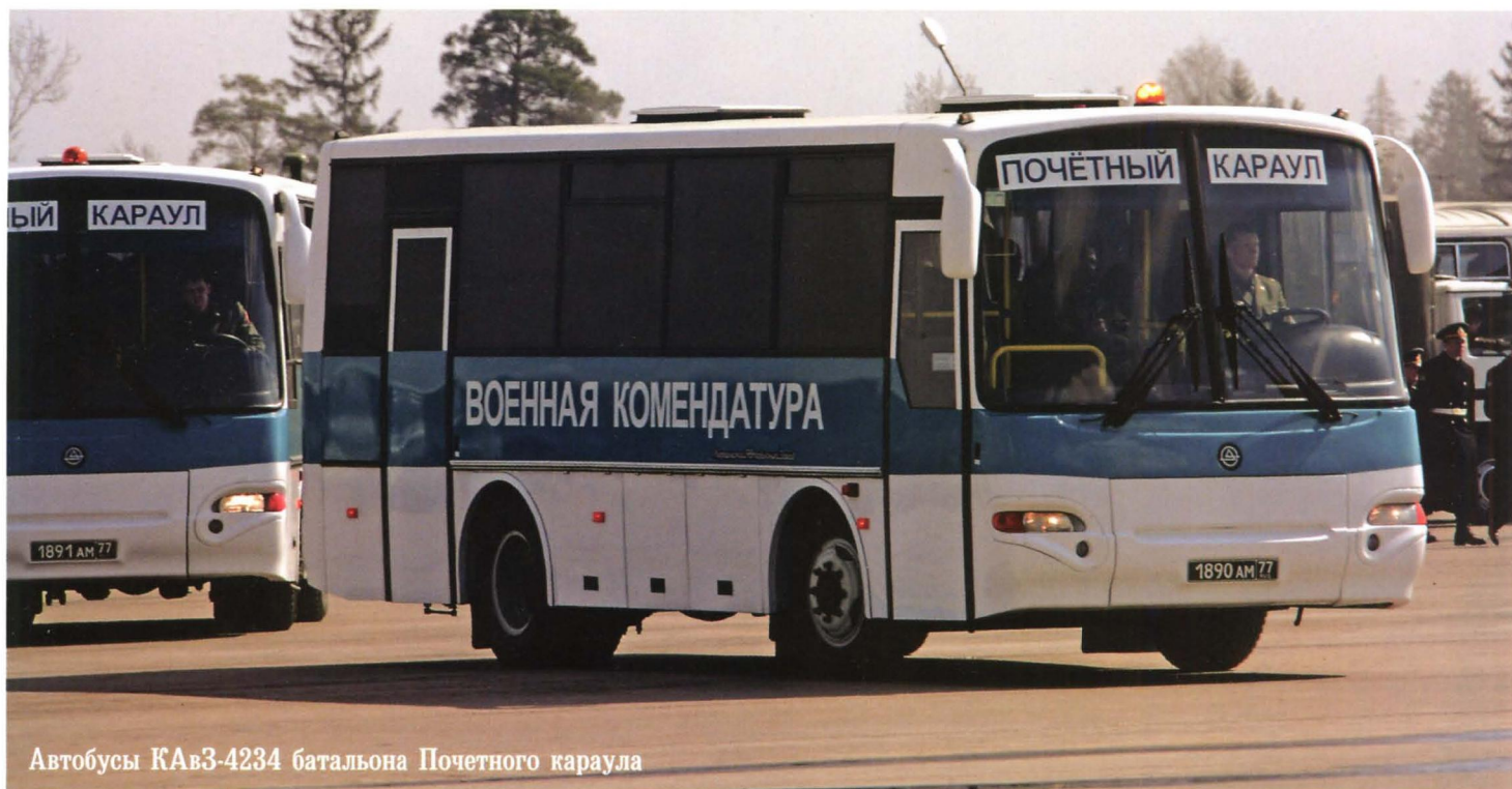
Автобусы КАВЗ-4234 батальона Почетного караула

Со временем 24-е «Волги» стали использовать в военных комендатурах еще нескольких важнейших гарнизонов, например, Ленинграда и Берлина. Позже компанию «Волгам» составили внедорожники УАЗ-469Б в милицейском варианте — с жесткой крышей и отделением для задержанных. В Москве «уазиков» насчитывалось три десятка.