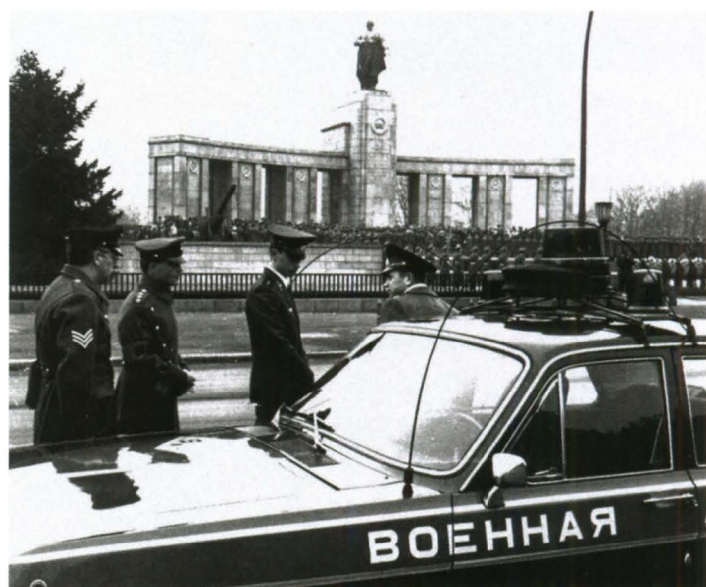
Патрулирование города во время торжественных мероприятий в Западной группе войск, Германия

автомобилей оперативных служб Вооруженных Сил. На легковых машинах комендантских подразделений и гарнизонных комендатур голубую полосу заменили надписью «ВОЕННАЯ КОМЕНДАТУРА», а грузовикам оставили только белый круг с буквой «К».