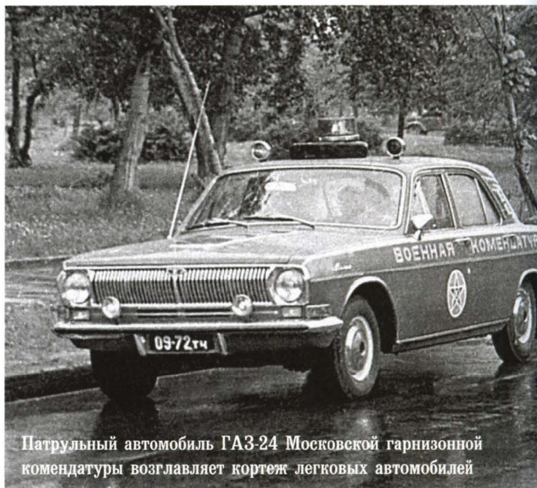
Патрульный автомобиль ГАЗ-24 Московской гарнизонной комендатуры возглавляет кортеж легковых автомобилей

Самыми представительными машинами гарнизонной комендатуры в советское время стали патрульные ГАЗ-24 «Волга» в специальной окраске, необычной не только для армейских автомобилей, но и для всего остального транспорта. Поскольку в семидесятые годы регламентированной цветографической схемы окраски машин гарнизонных комендатур не существовало, то пришедшие в московский гарнизон «Волги» были выкрашены с синева-зеленый цвет, как и комендантские «газики». Вдоль бортов проходили красные полосы с желтой окантовкой и надписью «ВОЕННАЯ КОМЕНДАТУРА», тоже желтого цвета. Аналогичная полоса с надписью «КОМЕНДАТУРА» имела и сзади на торцевой части крышки багажника. Красные полосы с желтой окантовкой нанесли также на капот и крышку багажника. На полосе, которая проходила по капоту, красовался голубой ромб