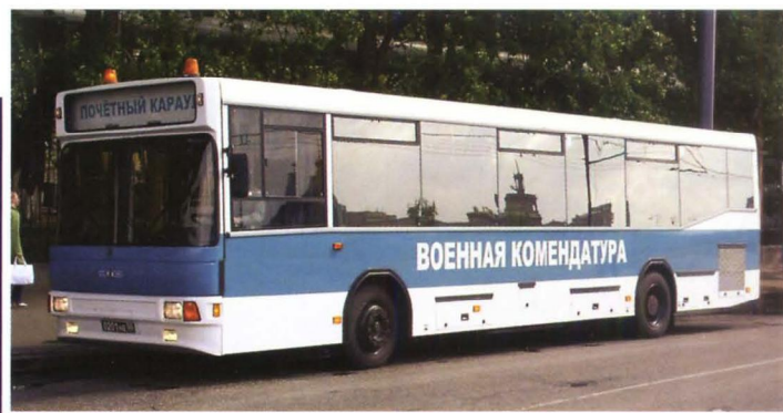
Автобус НефАЗ-5299 батальона Почетного караула