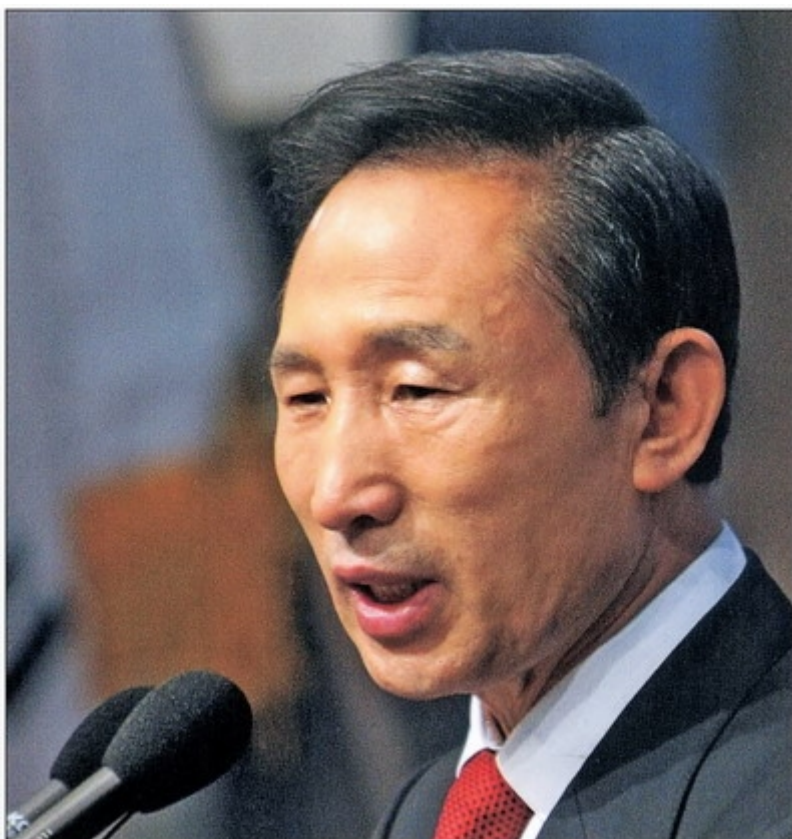
Ли Мён Бак, президент республики Корея, вступивший в должность 25 февраля 2008 г.