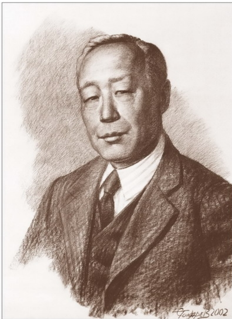
Ли Сын Ман, первый президент Республики Корея (1948-1960)