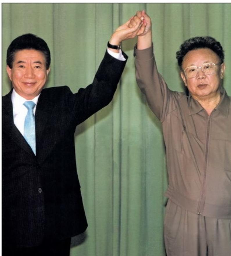
Встреча Ким Чен Ира и Но Му Хёна (октябрь 2007 г.)