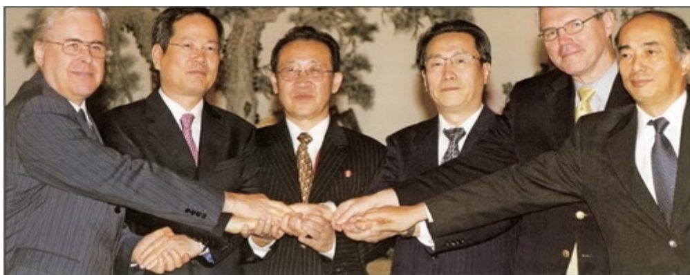
Шестисторонние переговоры по урегулированию корейского ядерного кризиса