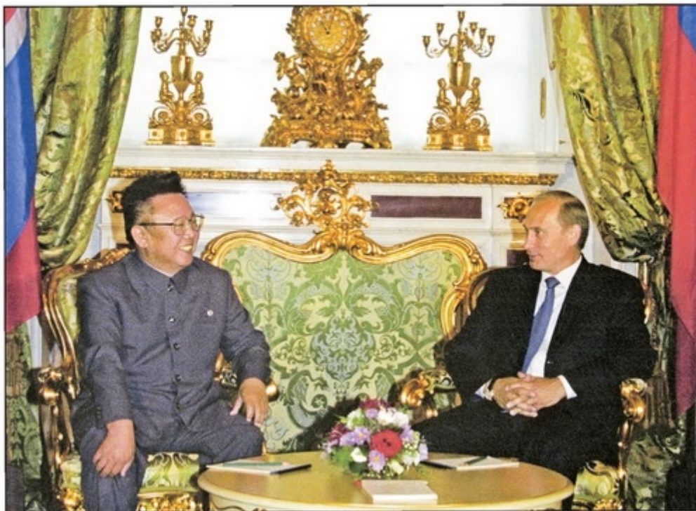
Встреча В. Путина с Ким Чен Иром (Москва, август 2001 г.)