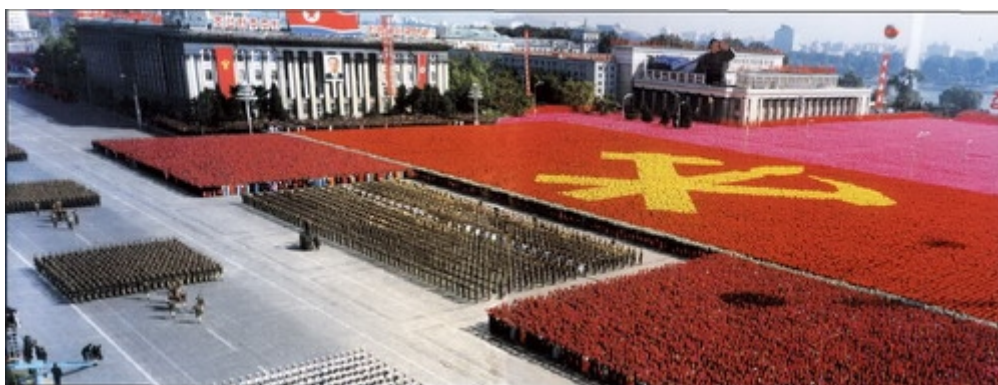
Военный парад в Пхеньяне