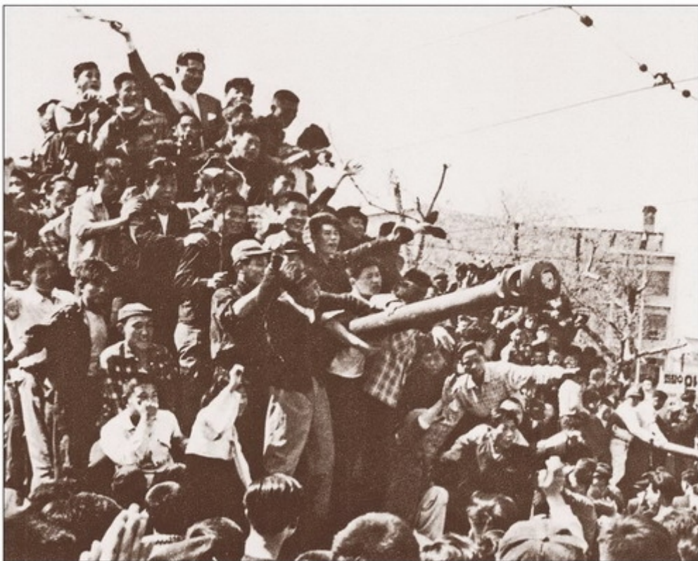
Апрельская революция в Южной Корее (апрель 1960 г.)