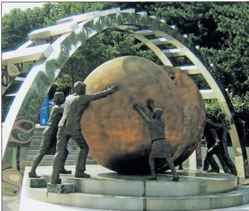
Монумент, символизирующий грядущее объединение Кореи (Южная Корея)