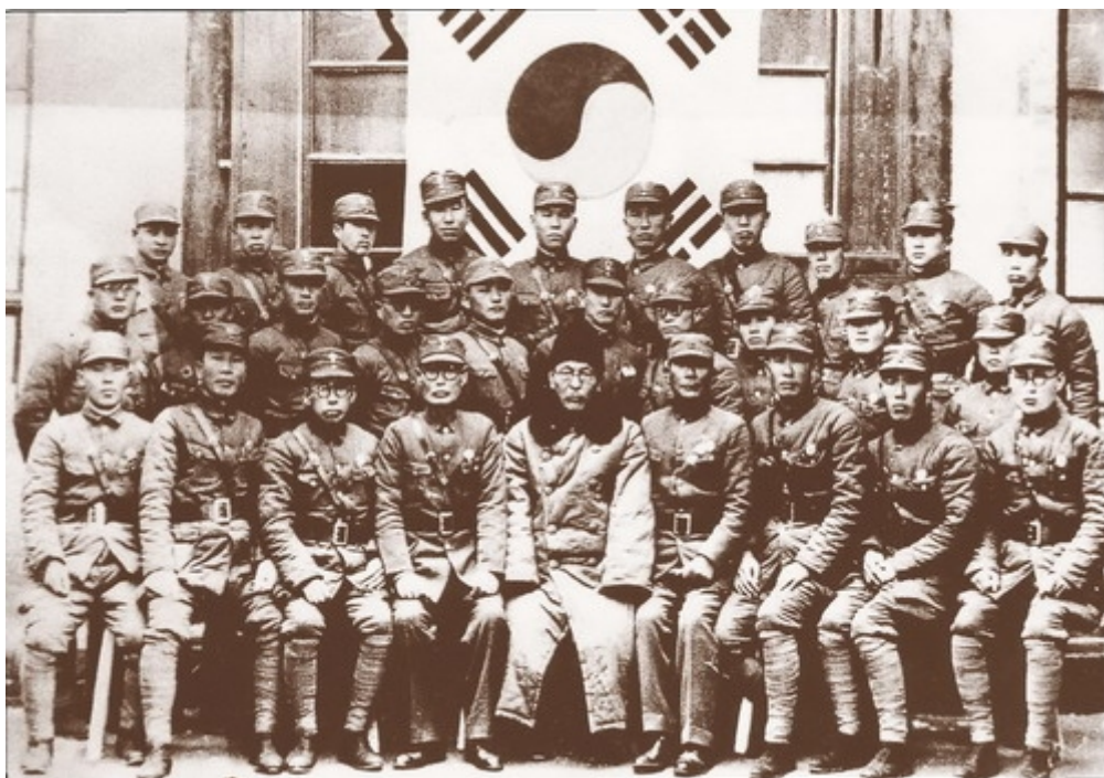
Командиры Корейской антияпонской армии (декабрь 1940 г.)