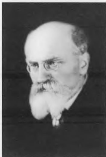
Рязанов Давид Борисович (1870–1938)