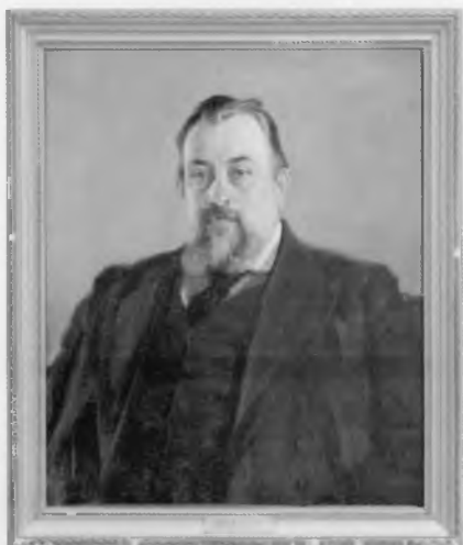
Ковалевский Максим Максимович (1851—1916)