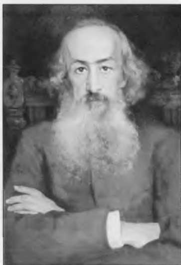
Бестужев-Рюмин Константин Николаевич (1829–1897)