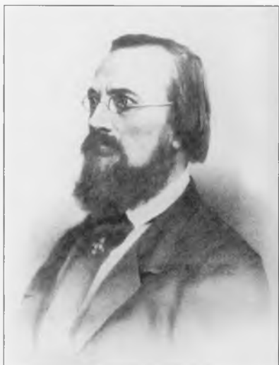
Костомаров Николай Иванович (1817–1885)