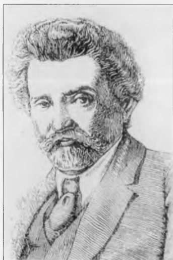
Довнар-Запольский Митрофан Викторович (1867—1934)