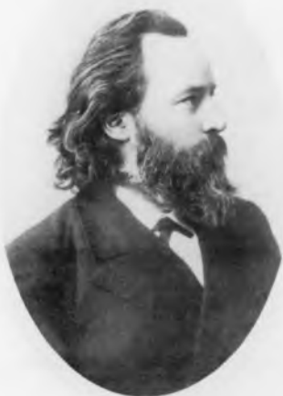
Кареев Николай Иванович (1850—1931)