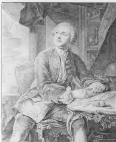
Ломоносов Михаил Васильевич (1711—1765)