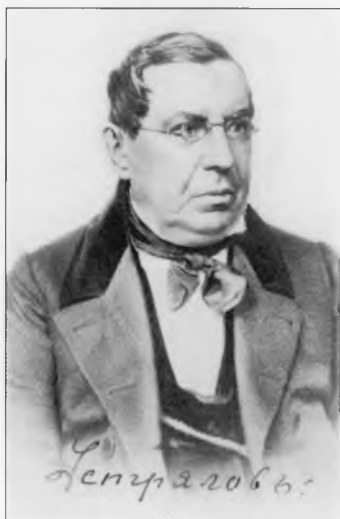
Устрялов Николай Герасимович (1805–1870)