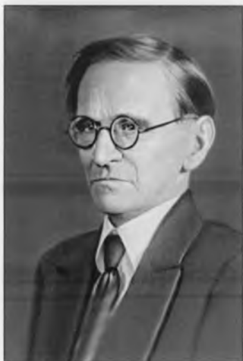
Веселовский Степан Борисович (1876–1952)