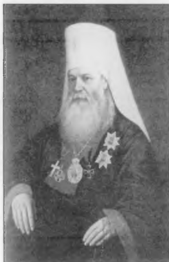
Макарий, митр. Булгаков Михаил Петрович (1816—1882)