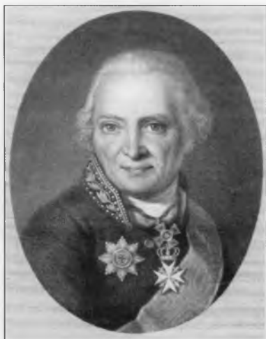
Бантыш-Каменский Николай Николаевич (1737—1814)