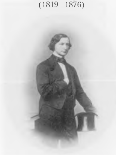
Самарин Юрий Федорович (1819–1876)