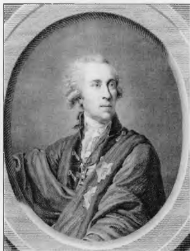
Мусин-Пушкин Алексей Иванович (1744—1817)