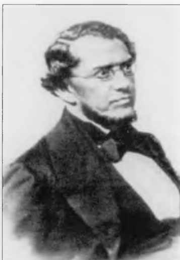
Кавелин Константин Дмитриевич (1818–1885)