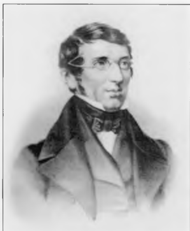
Надеждин Николай Иванович (1804–1856)