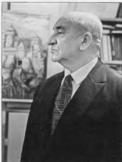
Рыбаков Борис Александрович (1908–2001)