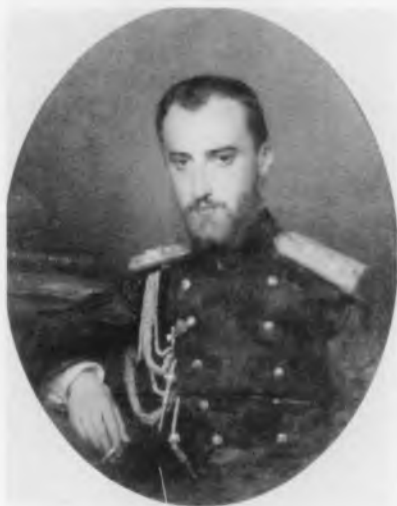
Николай Михайлович великий князь (1859—1919)