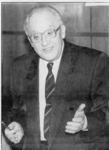
Поляков Юрий Александрович (1921–2012)