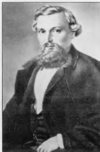
Иловайский Дмитрий Иванович (1832–1920)