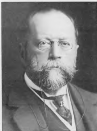
Виноградов Павел Гаврилович (1854—1925)