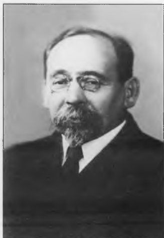
Валк Сигизмунд Натанович (1887–1975)