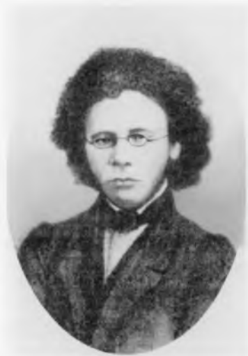
Шапов Афанасий Прокопьевич (1831–1876)