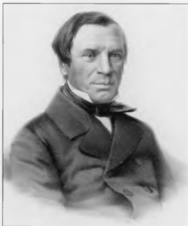
Погодин Михаил Петрович (1800–1870)