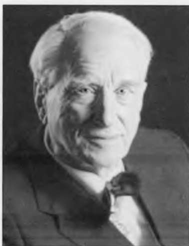
Пиотровский Борис Борисович (1908–1990)