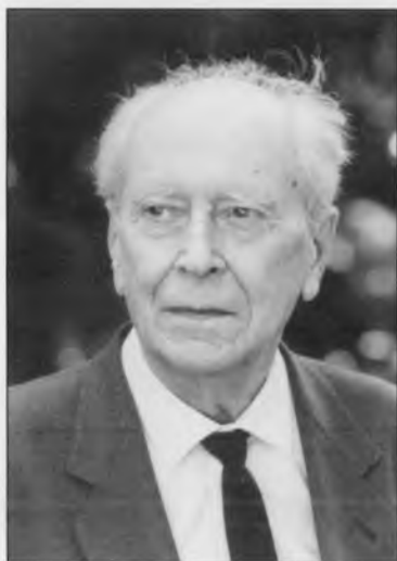
Лихачев Дмитрий Сергеевич (1906–1999)