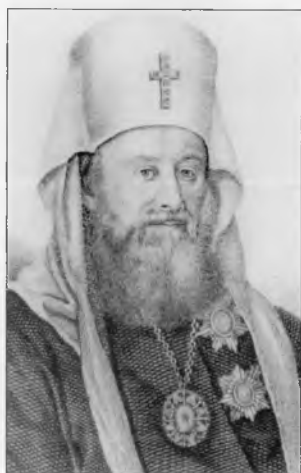
Евгений, митр. Болховитинов Евфимий Алексеевич (1767—1837)