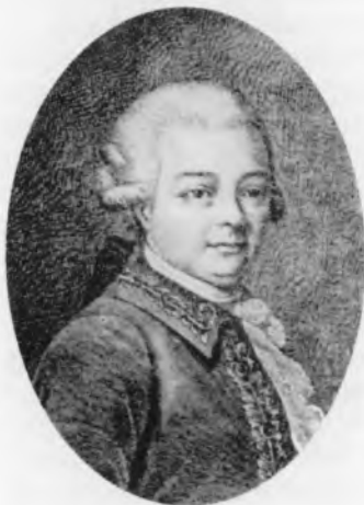
Болтин Иван Никитич (1735—1792)