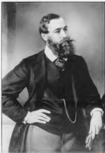
Чичерин Борис Николаевич (1828–1904)