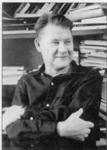
Окладников Алексей Павлович (1908–1981)