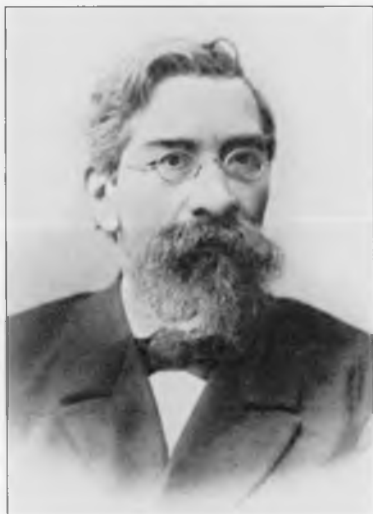
Кондаков Никодим Павлович (1844–1925)