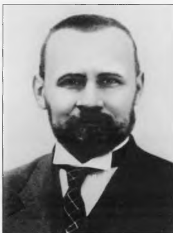
Вернадский Георгий Владимирович (1887–1973)