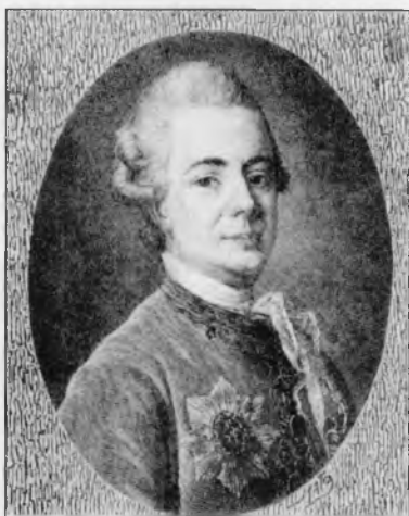
Щербатов Михаил Михайлович (1733—1790)