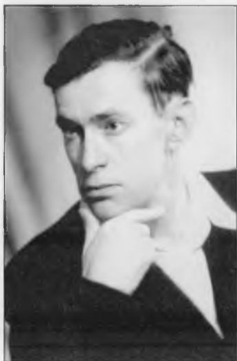
Зимин Александр Александрович (1920–1980)