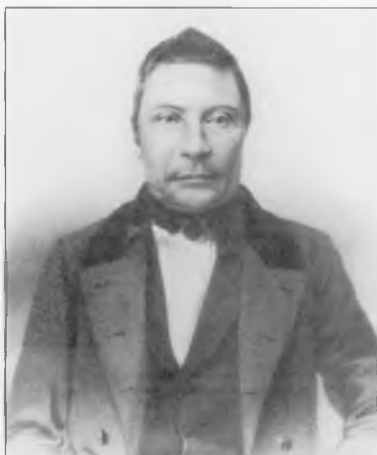
Беляев Иван Дмитриевич (1810—1873)