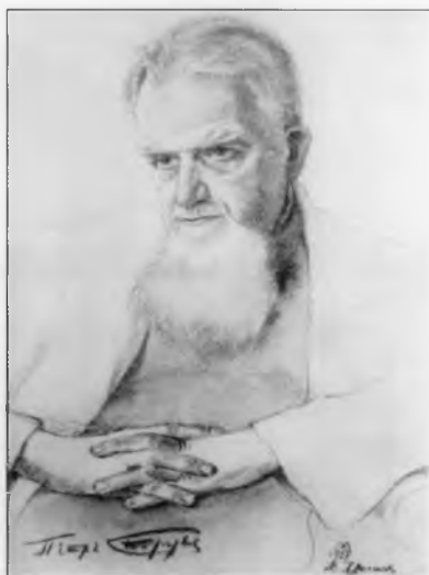
Струве Петр Бернгардович (1870–1944)