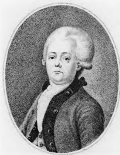
Чулков Михаил Дмитриевич (1743—1793)