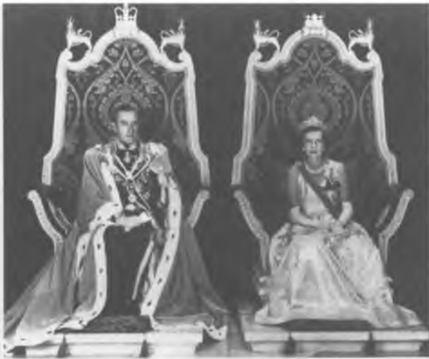
36. Последний вице-король Индии вместе с вице-королевой Маунтбаттен открыто заявлял о приверженности демократии, но ни один из вице-королей не прославился так проведением церемоний и показным величием.