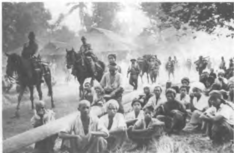
30. Японцы идут на Рангун, 1942 г.

Многие бирманцы смотрели на японских завоевателей, как на освободителей. Хотя азиатское правление оказалось более жестоким, чем западное, победы японцев положили конец Британской империи на Востоке.