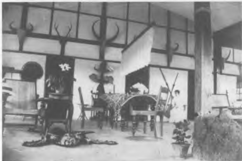
3. Имперский интерьер, 1890 г.

В Индии и других местах британские клубы и бунгало украшались охотничьими трофеями. Они прославляли храбрый дух правящей в империи расы.