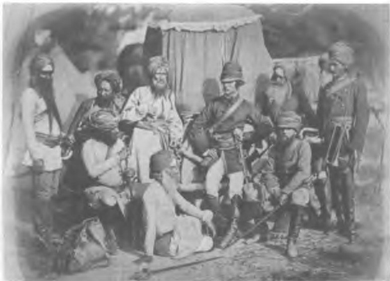
17. Офицеры и солдаты-сикхи, 1858 г.

Внушительные союзники британцев, сикхи, сыграли важную роль в подавлении восстания сипаев в 1857 г. Они подтвердили необходимость правления Индией по принципу «разделяй и властвуй».