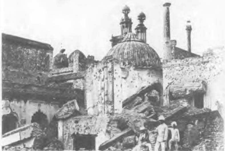
18. Лакхнау после восстания сипаев

Внушительные союзники британцев, сикхи, сыграли важную роль в подавлении восстания сипаев в 1857 г. Они подтвердили необходимость правления Индией по принципу «разделяй и властвуй».