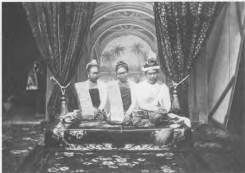
12. Король Тибо и царица Супаялат в Бирме

Несмотря на попытки модернизировать Бирму, британцы нанесли королю поражение и отправили в ссылку в 1885 г. Снимок короля Тибо в типичной обстановке сделан придворным фотографом-французом.