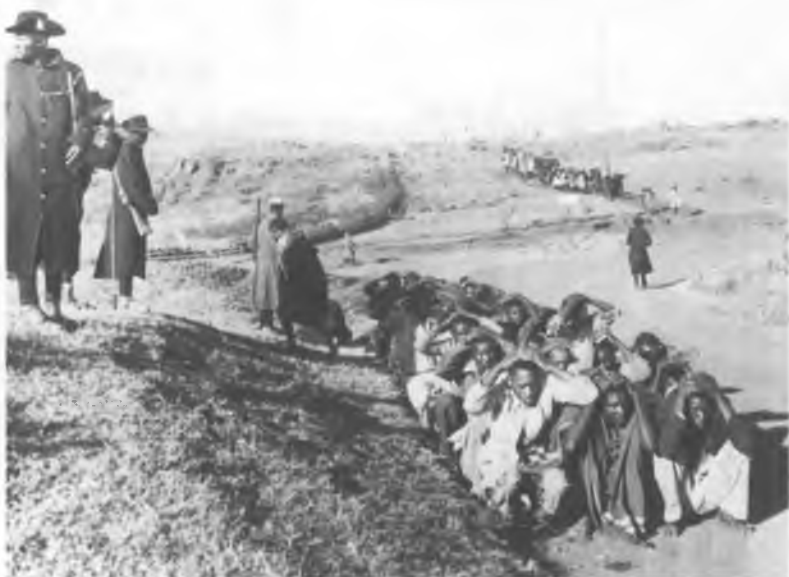
42. Задержание подозреваемых «мау-мау» в Кении, 1952 г.

Подавление восстания «мау-мау», которое включало зверства с двух сторон, в 1950-е гг. стало одним из самых ужасающих эпизодов в истории империи.