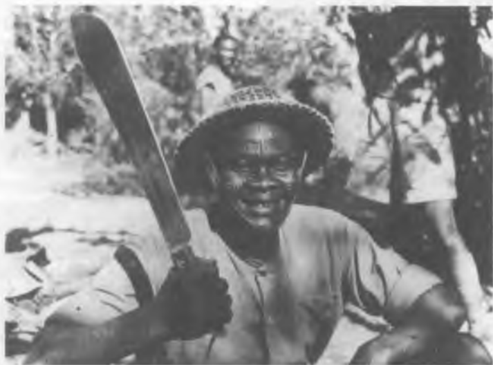
31. Нигерийский сержант в Бирме, 1944 г.

Многие бирманцы смотрели на японских завоевателей, как на освободителей. Хотя азиатское правление оказалось более жестоким, чем западное, победы японцев положили конец Британской империи на Востоке.