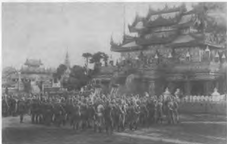
13. Рождество в Бирме, 1885 г.

Несмотря на попытки модернизировать Бирму, британцы нанесли королю поражение и отправили в ссылку в 1885 г. Снимок короля Тибо в типичной обстановке сделан придворным фотографом-французом.