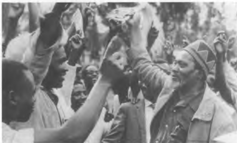
43. Джомо Кениату провозглашают премьер-министром, 1963 г.

Подавление восстания «мау-мау», которое включало зверства с двух сторон, в 1950-е гг. стало одним из самых ужасающих эпизодов в истории империи.