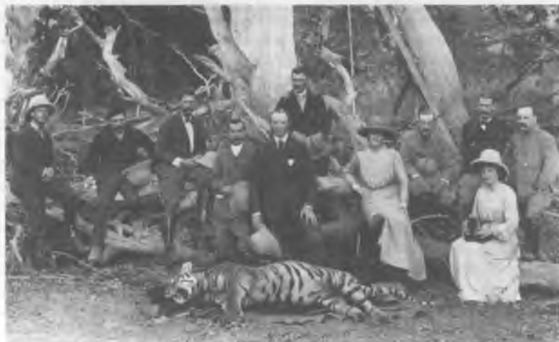
4. Лорд и леди Керзон охотятся в Хайдарабаде, 1902 г.

В Индии и других местах британские клубы и бунгало украшались охотничьими трофеями. Они прославляли храбрый дух правящей в империи расы.