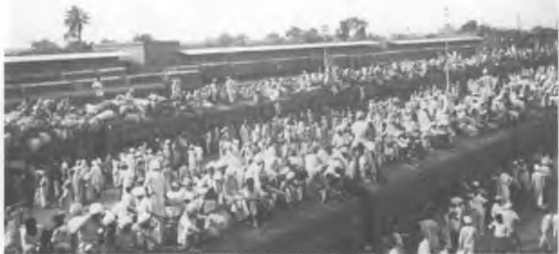
37. Беженцы после раздела Индии в 1947 г.

Британское владычество закончилось большим кровопролитием и массовой миграцией беженцев между Индией и Пакистаном. Самые ужасные бои происходили на железной дороге.