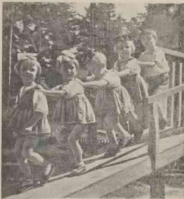
На деревянной горке

Ознакомимся вкратце с некоторыми научными данными, которые разработаны русскими учеными физиологами, главным образом великим Павловым.