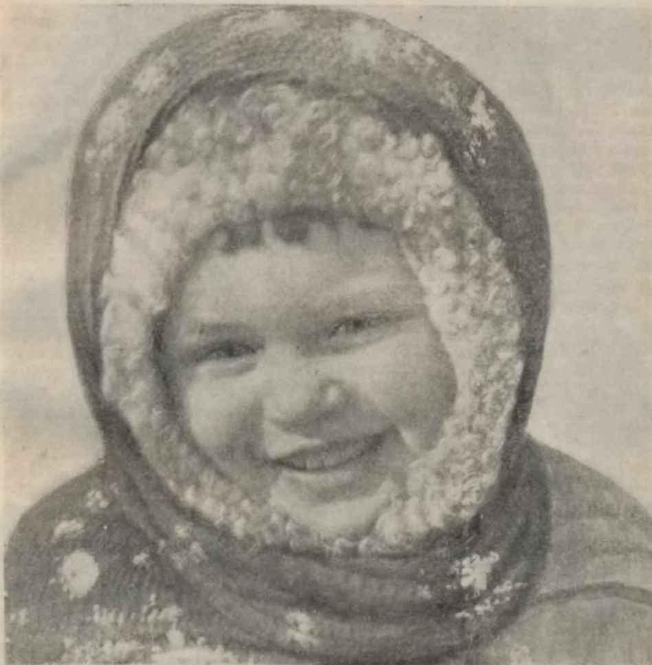
Воспитанница детского сада

В стране Сталинской конституции дошкольные детские учреждения — детские ясли, детские сады — органическая часть многогранной советской жизни. Они оказывают огромную помощь семье, матери в воспитании детей.